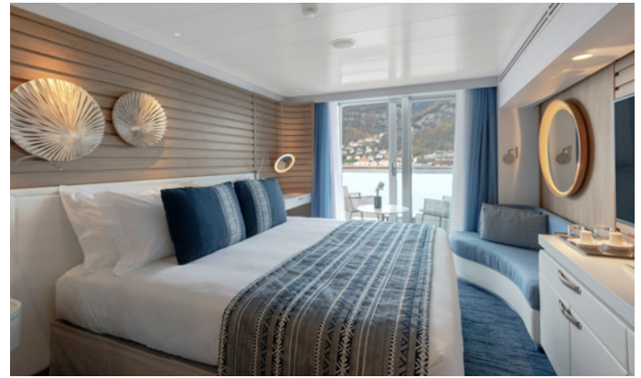
Prestige Stateroom auf der «Le Jacques Cartier»