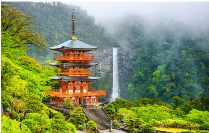
Der Seiganto-ji Tempel am Nachi-Wasserfall

von hier aus zu erobern. Heute ist Busan nach Seoul die zweitgrösste Stadt Koreas mit moderner Skyline und Meereshafen-Atmosphäre. Wir besuchen den an der felsigen Küste gelegenen Haedong-Yonggungsa-Tempel und schlendern über einen lebhaften Fischmarkt.