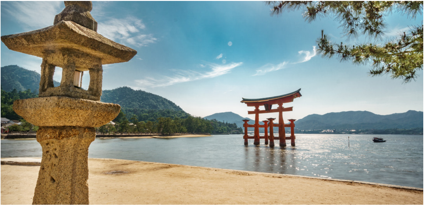
Das berühmte Torii-Tor auf der Insel Miyajima