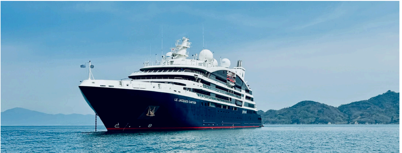
Die «Jacques Cartier» der Reederei Ponant fährt uns durch die faszinierende Inselwelt Japans