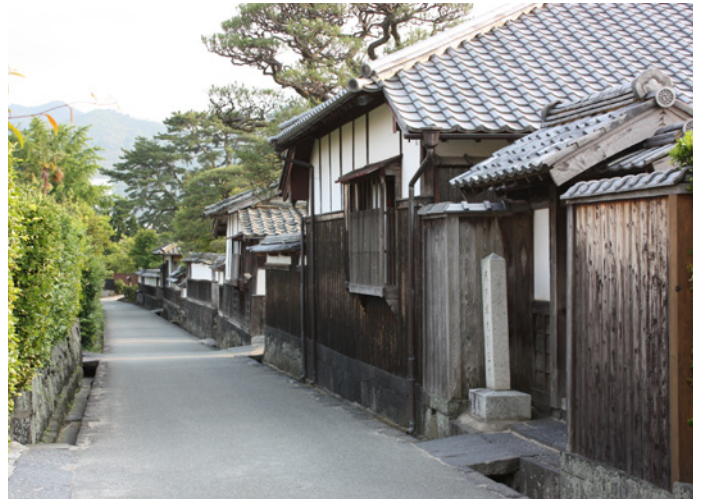
Traditionelle Architektur in der Hafenstadt Hagi

Busan besitzt einen hervorragend geschützten Hafen. Im 13. Jh. versuchten die Mongolen vergeblich Japan