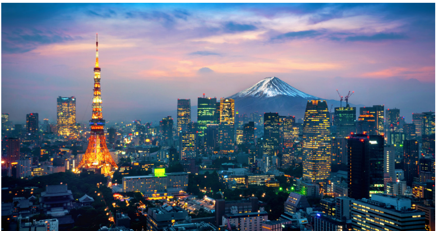
Zum Abschluss der Reise geniessen wir das Lichtermeer von Tokio

Fahrt mit dem Bus zum Flughafen. Wir verlassen Tokio und erreichen Zürich am selben Abend.