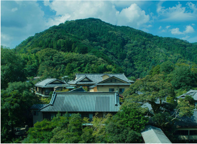
Blick auf das Ryokan auf der Izu-Halbinsel