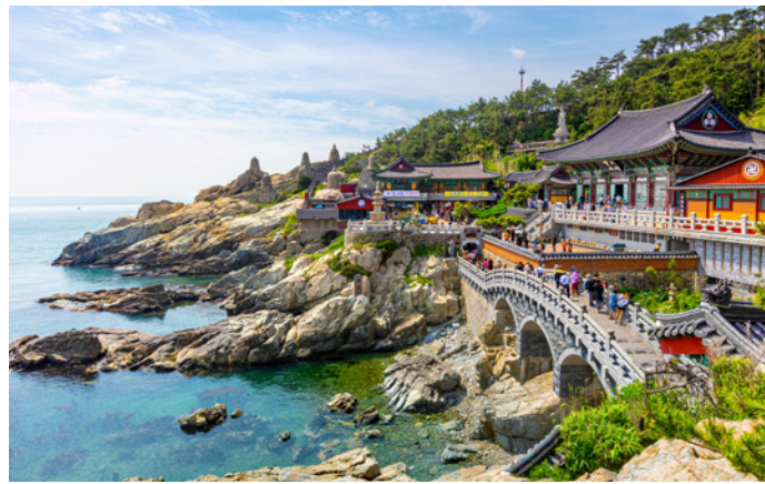
Stippvisite in Korea: Besuch des Haedong Yonggungsa-Tempels

Von Shimonoseki aus bringt uns die Jacques Cartier zwischen Kyushu und Shikoku auf den offenen Pazifik. Wir geniessen die feine Küche und das Leben an Bord. Dr. Rhyner bereitet Sie auf die Höhepunkte der nächsten Tage vor.