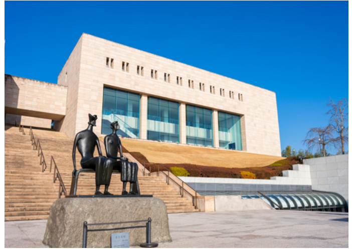
MOA-Kunstmuseum in Atami