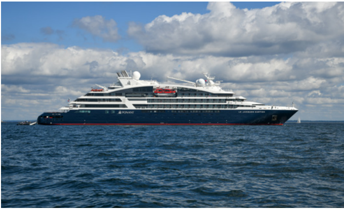
«Le Jacques Cartier» von PONANT