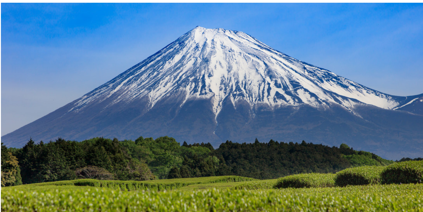
Grünteeplantagen mit Blick auf den Fuji

Yaizu in der Suruga-Bucht ist bekannt für Fischerei und Thunfisch. Wir besuchen den Fischmarkt, geniessen frischen Fisch und sehen erstmals den Fuji vom Meer. Die Region gehört zudem zur Präfektur Shizuoka, die für ihre weitläufigen Teeplantagen und die Produktion von erstklassigem Grüntee berühmt ist.