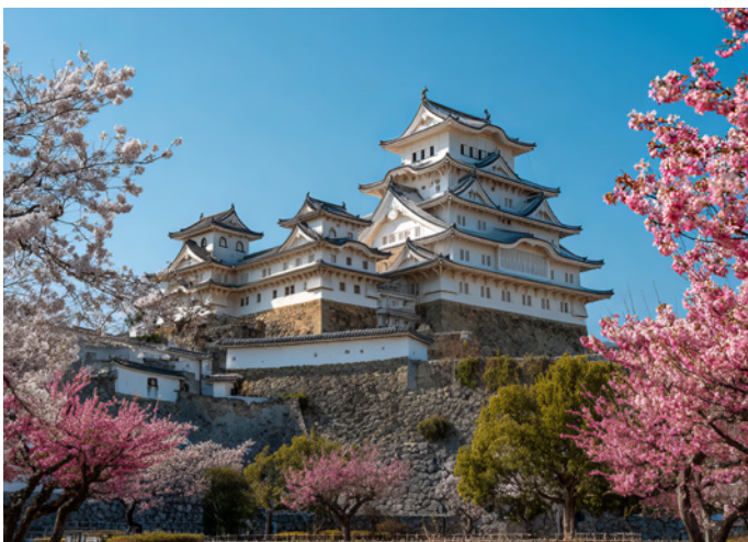
Burg Himeji – historische Architektur zwischen blühenden Bäumen

Am Morgen erleben bei einem geführten Spaziergang nochmals die spirituelle Atmosphäre dieser einzigartigen Tempelstadt. Der Bus bringt uns nach Kobe, eine moderne Grossstadt mit einem der ältesten und grössten Häfen Japans. Hier empfängt uns der französische Luxuskreuzer „Le Jacques Cartier“, der für die kommenden zwei Wochen unsere Unterkunft sein wird.