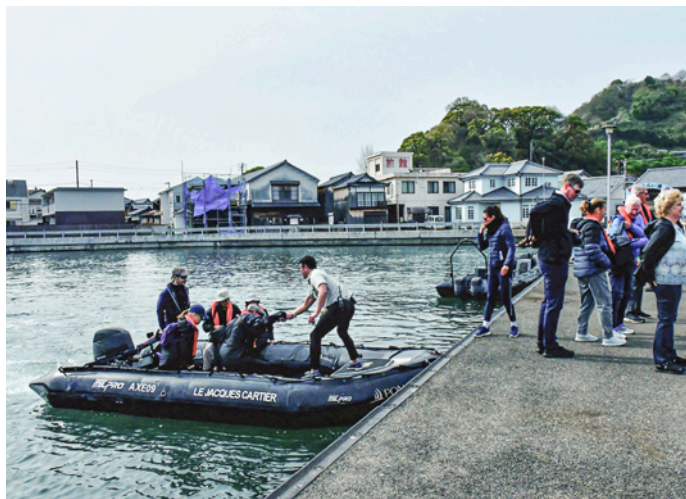
Ausflüge mit schiffseigenen Zodiac-Booten erlauben uns abgelegene Orte zu erreichen

Auf der Insel Osaka Shimojima besuchen wir das Hafentädtchen Mitarai, dessen Strassenzüge aus der Edo-Zeit (1603–1868) erhalten geblieben sind. Während jener Zeit durften keine seetüchtigen Schiffe gebaut werden – daher war der Hafen ein beliebter Zwischenstopp der Inlandsee. Am Hafen erleben wir eine Biwa- bzw. Gagaku-Vorführung und lauschen den Klängen der japanischen Harfe (Koto). Danach bleibt Zeit zum Schlendern und Entdecken.