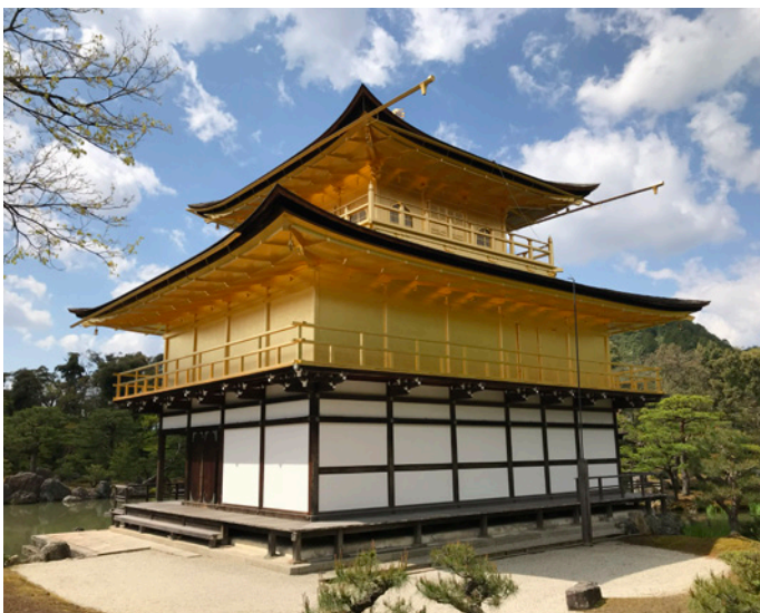
Der goldene Pavillon-Tempel Kinkaku-ji in Kyoto