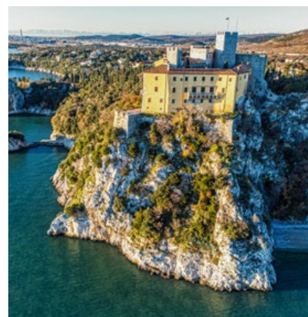
Spektakulär gelegen; Schloss Duino