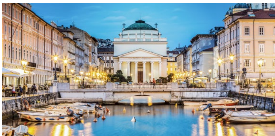
Am Canale Grande von Triest