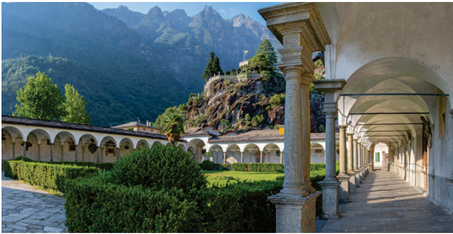
San Lorenzo in Chiavenna