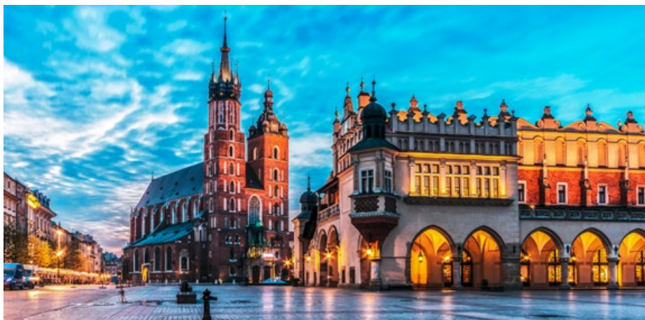
Abends auf dem Marktplatz von Krakau