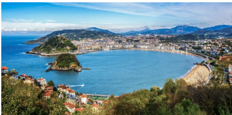
Die Bucht «La Concha» in San Sebastián