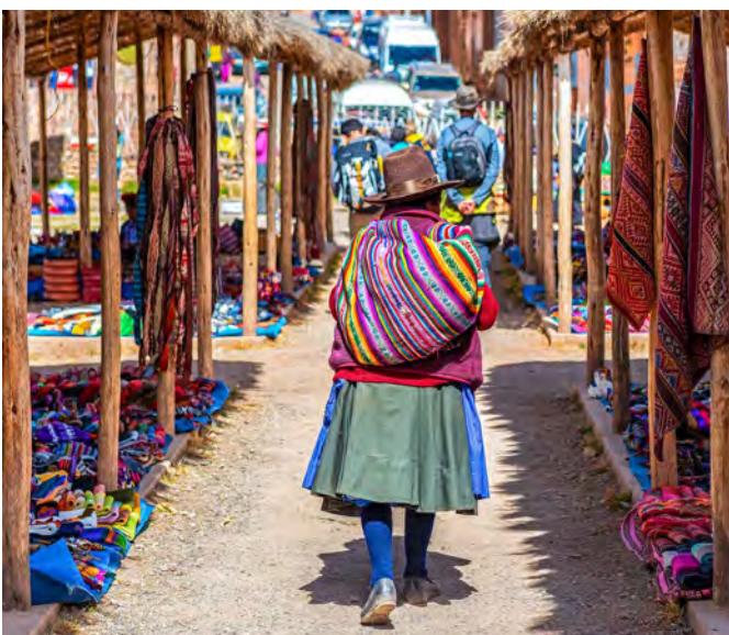
Auf dem Markt von Chinchero

Zum Abschluss unserer Reise besuchen wir das Museo Larco im Distrikt Pueblo Libre mit seinem exquisiten Museums-Restaurant, bevor wir zum Flughafen gebracht werden. Rückflug am späteren Abend über Madrid nach Zürich. Ankunft in Zürich am Freitag (16. Oktober) abends.