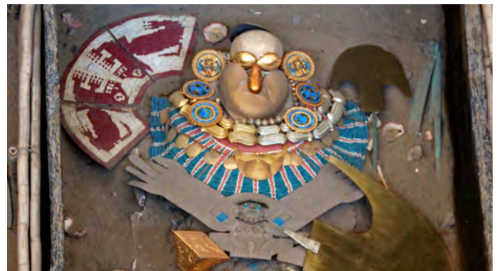
Grabrekonstruktion des Herrn von Sipán