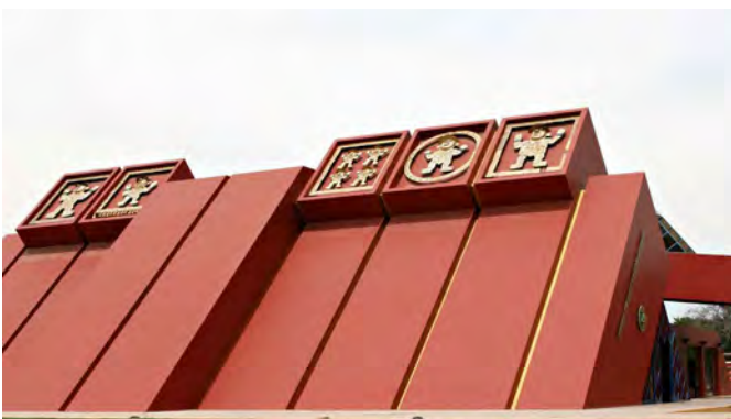
Mit Schweizer Unterstützung gebaut - das Museo Tumbas Reales de Sipán

In der breiten Flussoase von Chiclayo liegen über viertausend Jahre alte Ruinen von wahrscheinlich religiösen Gemeinschaftszentren. Sie werden erst seit wenigen Jahren archäologisch untersucht und erzählen bereits faszinierende Geschichten. Unter der Leitung der lokalen Archäologen besuchen wir die Ausgrabungsstätten und lassen uns auf den neuesten Forschungsstand bringen. Der Besuch im Convento San Agustín bringt uns in die Kolonialzeit zurück.