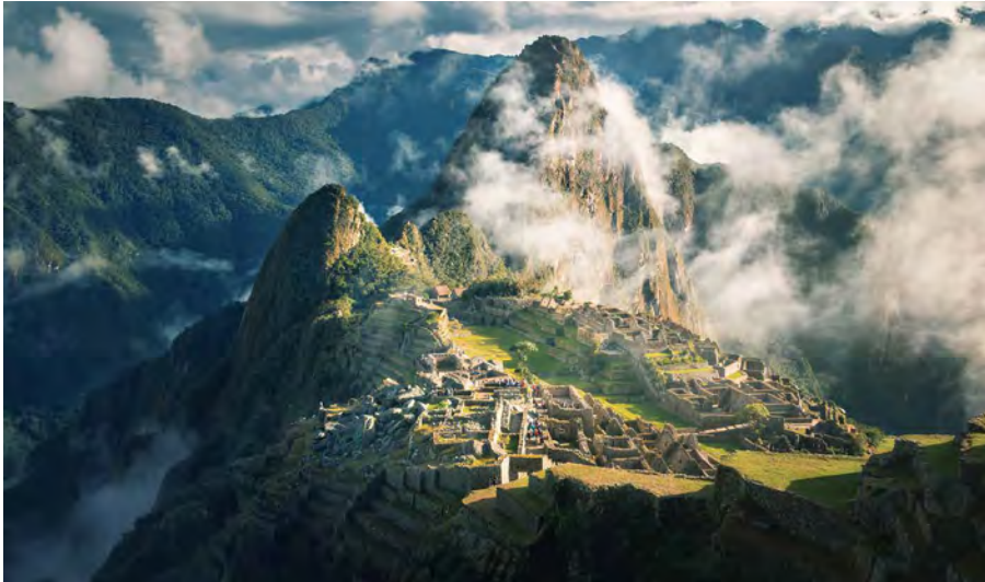
Sagenumwoben - die Inka-Stadt Machu Picchu