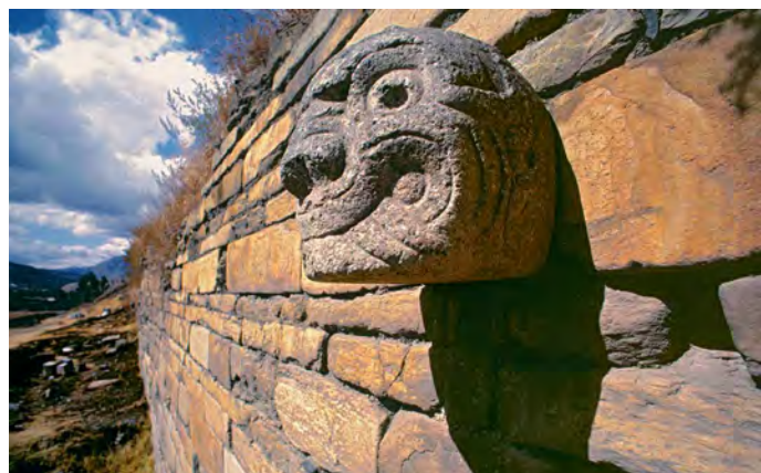
Chavín de Huántar

Die Ruinenstätte von Chavín de Huántar erreichen wir nach einer rund vierstündigen Fahrt durch die spektakuläre Andenlandschaft über einen fast fünftausend Meter hohen Pass. Die Ruinen gehören seit 1985 zum UNESCO-Weltkulturerbe und zu den wichtigsten archäologischen Fundstätten weltweit. Wir besuchen den geheimnisvollen Tempel mit seinen verwinkelten dunklen Gängen, vielen Steinskulpturen und Platzanlagen. Im Museo Nacional Chavín bewundern wir die Kunstwerke, die mithilfe des schweizerischen Bundesamtes für Kultur zwischen 2011 und 2015 konserviert werden konnten.