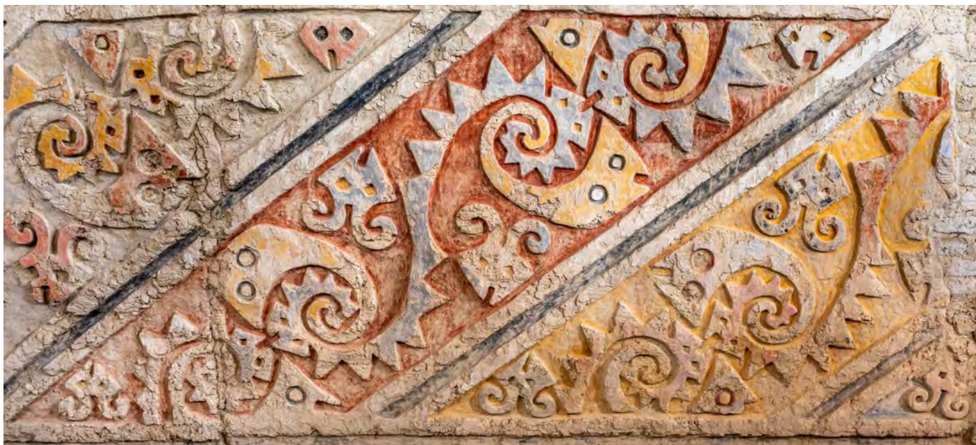
Relief in El Brujo bei Trujillo