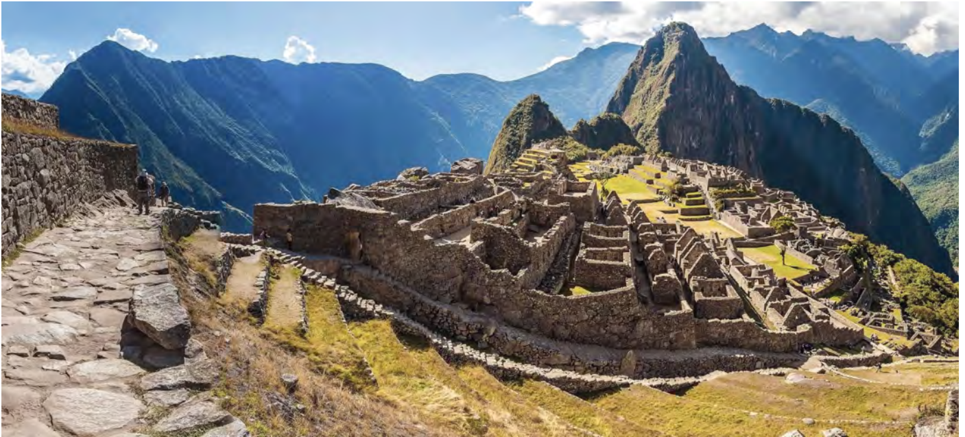
Aussicht auf Machu Picchu