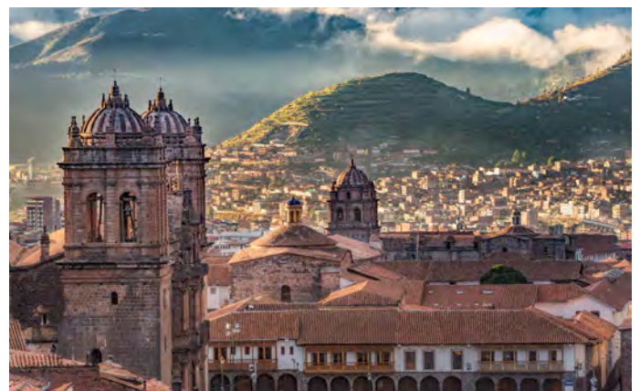
Blick über Cusco