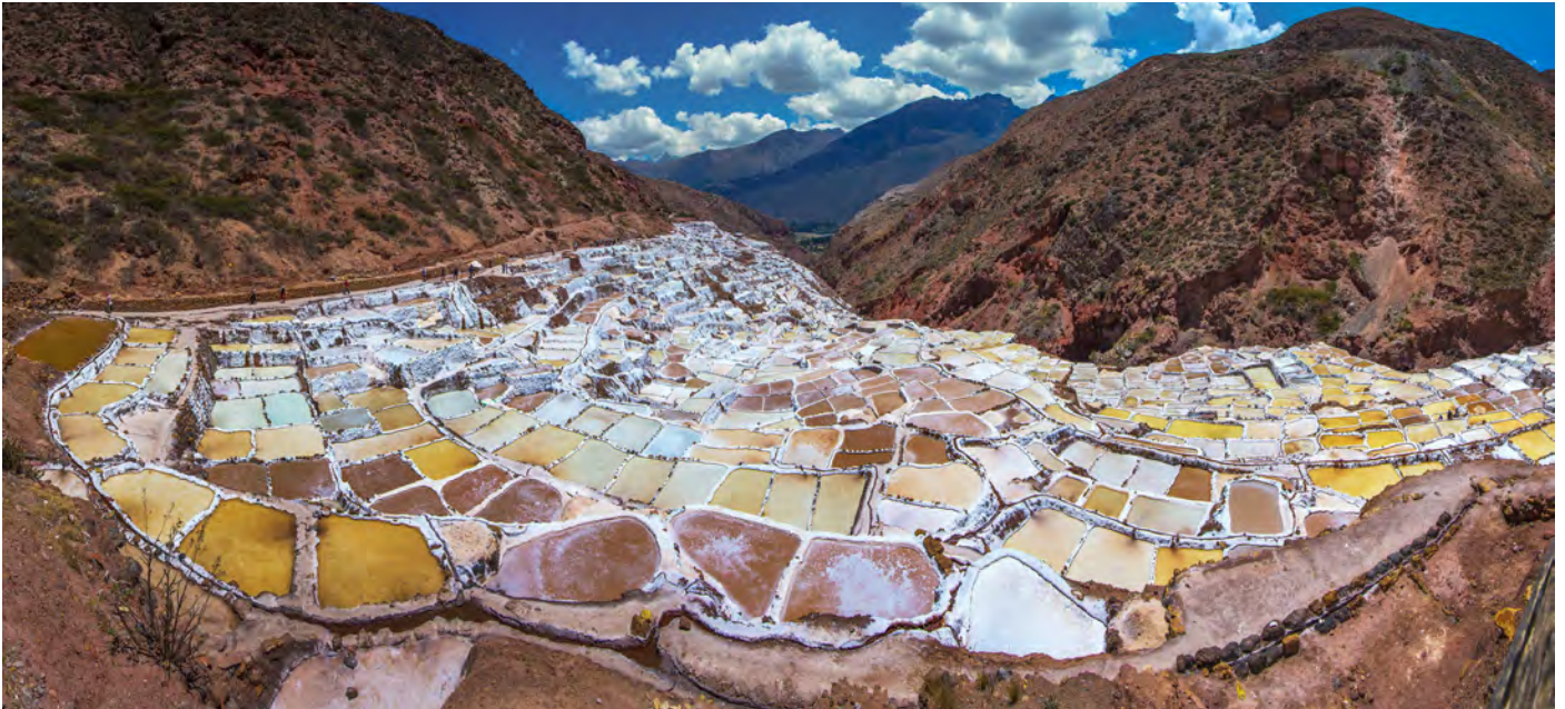
Die Salinen von Maras