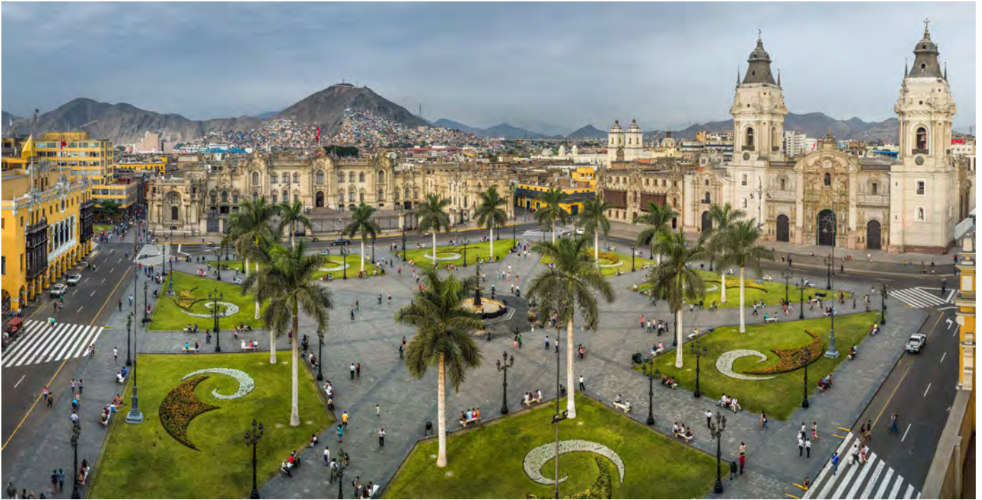
Die koloniale Altstadt von Lima