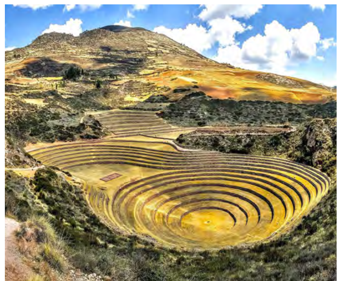
Die Terrassenanlagen von Moray