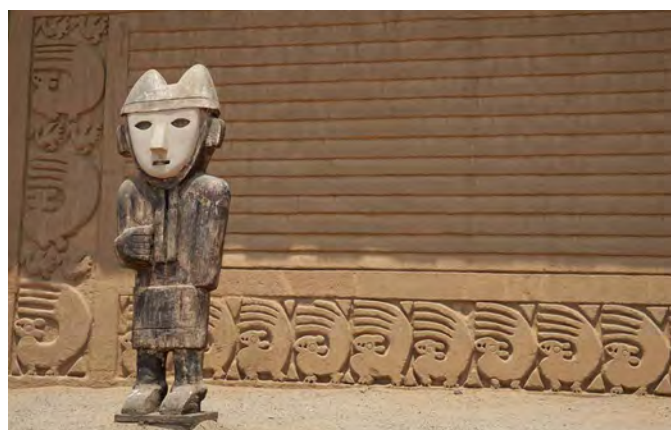
In der Ruinenstadt Chan Chan

Im unteren Casma-Tal liegen die wohl ältesten monumentalen Lehmbauten Amerikas. Die U-förmigen Gebäude sind zwischen vier- und fünftausend Jahre alt und verblüffen durch ihre Grösse. Die wissenschaftliche Erforschung ist hier noch längst nicht abgeschlossen, es warten noch viele Geheimnisse in der Erde. 1 Übernachtung in Casma.