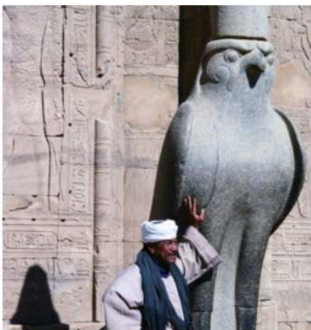
Im Hours-Tempel von Edfu

Morgens fahren wir nach Dahschur, wo die Knickpyramide und die Rote Pyramide auf den Herrscher Snofru zurückgehen. Von ferne können wir die Schwarze Pyramide des Königs Amenemhet III. aus der 12. Dynastie sehen. Danach besuchen wir Memphis, die alte Hauptstadt Ägyptens, von deren einstigem Glanz nur noch wenige Überreste zeugen. Ganz in der Nähe liegt Saqqara. Von Weitem sieht man bereits die Stufenmastaba des Djoser aus der dritten Dynastie, das älteste Steinbauwerk Ägyptens. Weitere Besichtigungen des heutigen Tages sind eine Pyramide mit Pyramidentexten, Gräber des Alten Reiches und, falls geöffnet, Persergräber und das Serapeum, die Begräbnisstätte der heiligen Apisstiere.