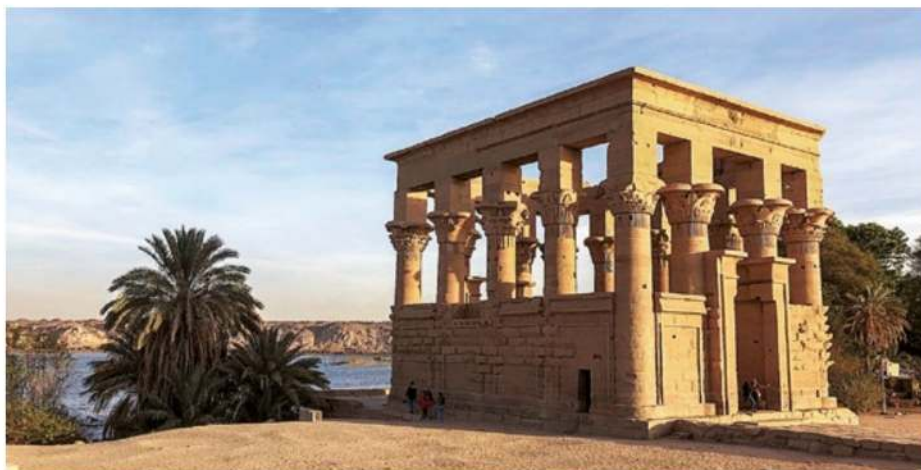
Der Kiosk des Tempels von Philae auf der Insel Agilkia