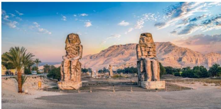
Die Memnonkolosse auf Thebens Westseite

der Siedlung selbst und einem kleinen ptolemäischen Tempel vor allem die Gräber der Handwerker besonders sehenswert. Die Abbildungen der sogenannten Privatgräber lassen Leben und Jenseitsvorstellungen im Alten Ägypten lebendig werden.