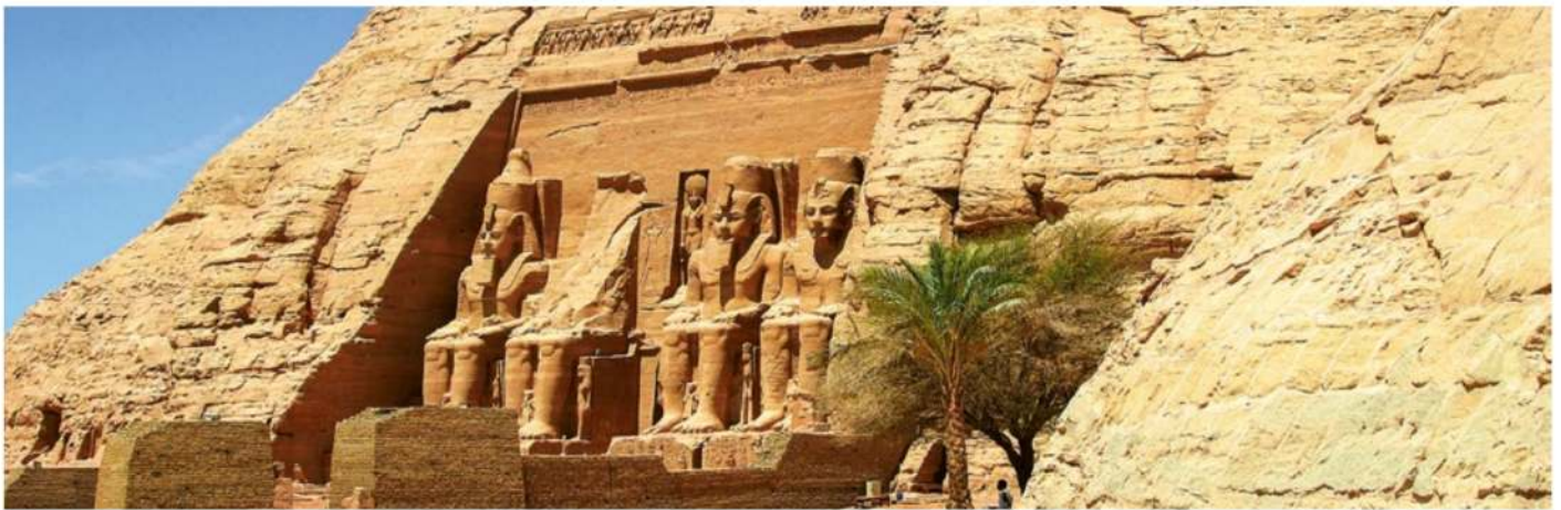
Unser Ziel – die eindrückliche Tempelanlage von Abu Simbel