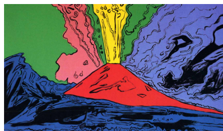
«Vesuv», Andy Warhol

Auf dem Weg zum Flughafen von Neapel besuchen wir den spätantiken Kirchenkomplex von Cimitile. Rückflug nach Zürich.