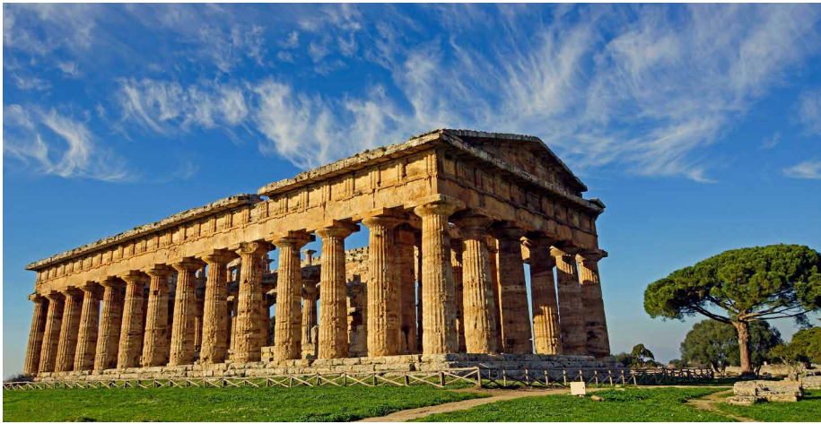
Poseidontempel in Paestum