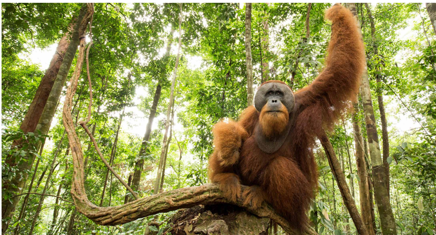
Orang-Utan im Gunung-Leuser-Regenwald