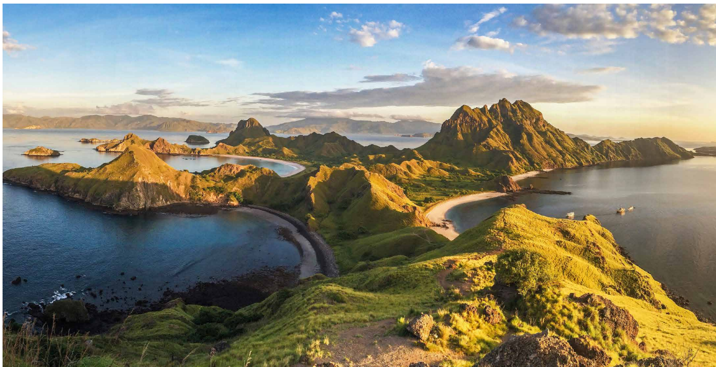
Aussicht auf den Komodo-Archipel