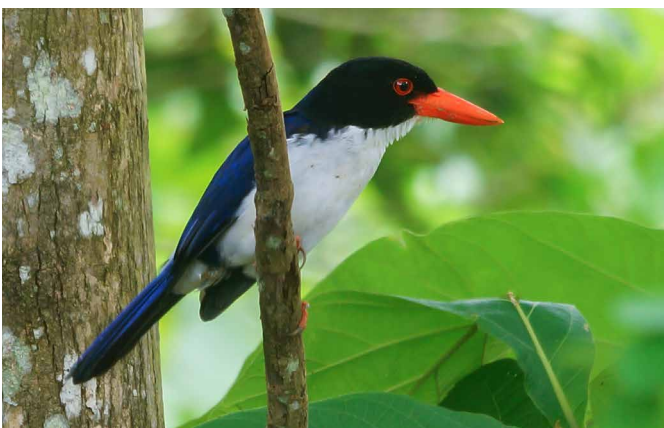
Glitzerlied - ein Vertreter der Vogelwelt auf Flores

Wir fahren in das kleine Dorf Melo, wo wir von Angehörigen des Menggarai-Volkes erwartet werden und Einblick in ihre Kultur erhalten. Auf dem Rückweg nach Labuan Bajo lernen wir im Dorf Rumah Tenun die Kunst der Ikat-Herstellung kennen, die traditionellen Webarbeiten die typisch sind für die indonesischen Inseln. Jede Region hat ihre eigenen Muster. Bevor wir zum Hotel zurückkehren, erkunden wir die Spiegelhöhle, deren Steine durch den Lichteinfall wie Spiegel glänzen.