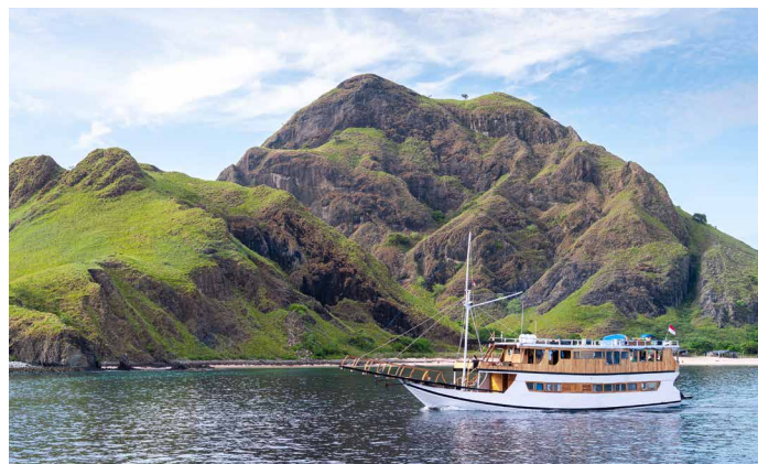
Per Boot unterwegs im Komodo-Archipel

Nur auf dem Komodo-Archipel leben derzeit noch etwa 5000 Komodowarane. Heute beginnt die Inselfahrt auf einem traditionellen Holzboot. Eine erste Anlandung erwartet uns auf der Insel Insel Rinca. Von einem lokalen Ranger begleitet unternehmen wir eine leichte Wanderung durch den Trockenwald und die Savanne, wo wir die eindrucksvollen Komodowarane in ihrer natürlichen Umgebung aus sicherer Distanz beobachten. Nach dem Besuch des örtlichen Museums fahren wir weiter zur Insel Kalong. Ein spektakuläres Erlebnis erwartet uns bei Sonnenuntergang, wenn tausende Flughunde ihren Rastplatz verlassen und den Himmel verdunkeln. 1 Übernachtung auf dem Boot in klimatisierten Kabinen.