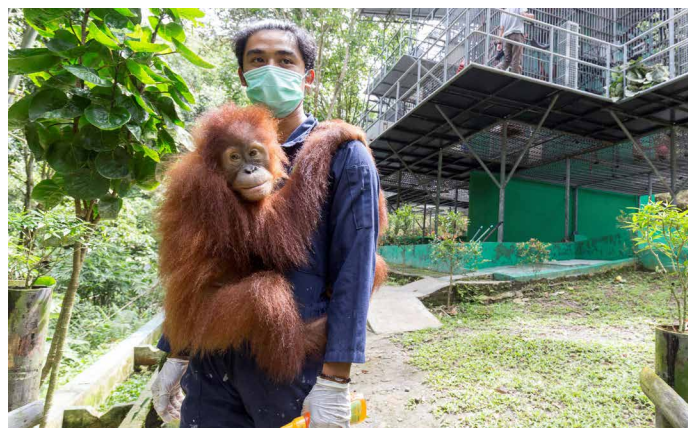
Tierpfleger im «Orang-Utan Haven»

Am Morgen besuchen wir das zweite Projekt des Sumatra-Orang-Utan-Schutzprogramms SOCP: Die Auffang- und Pflegestation. Nach der Befreiung der Orang-Utans aus ille-