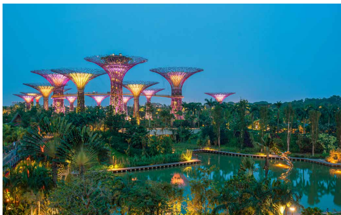
Gardens by the Bay in Singapur

Wir besuchen das Mandai Wildlife Resort im Zoo Singapur, einem der führenden Zoos der Welt, und treffen uns mit einer Mitarbeiterin von Mandai Nature, die die Asiatischen Naturschutzprogramme leitet. Mandai Nature koordiniert für die IUCN viele Naturschutzprogramme in Südostasien. Gegen Abend besuchen wir die Gardens by the Bay, ein 100 Hektar grosses Parkgelände, das auf künstlich aufgeschüttetem Land angelegt wurde. Der Park ist einer der grössten botanischen Gärten in Asien. Er zeigt eine grosse Pflanzenvielfalt im Flower Dome.