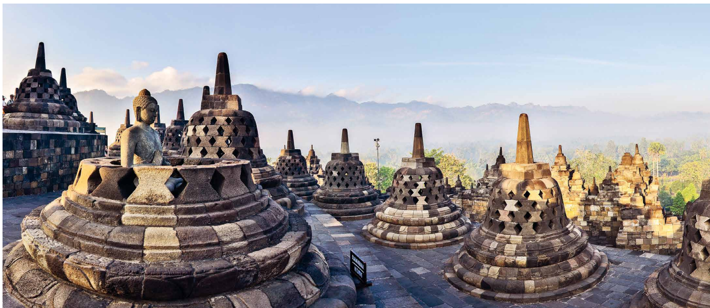
Der Tempel von Borobudur