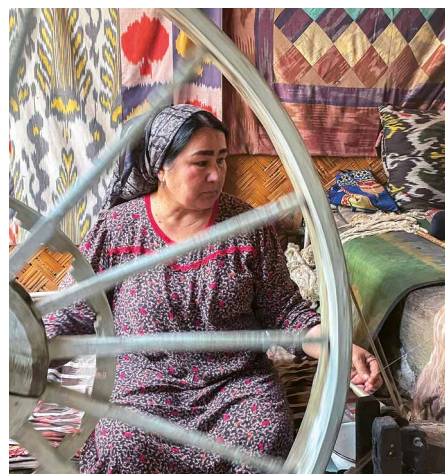
Seidenspinnerin in Margilan

Das sagenumwobene Samarkand ist eine der ältesten Städte Zentralasiens und beeindruckt mit monumentalen Bauwerken aus der Timuridenzeit. In der Nekropole Shah-i Zinda sehen wir ein Beispiel von timuridischer Baukunst mit schier unendlichen blaugliasierten Fliesen. Ulughbek, der Enkel Timurs, baute Samarkand im 15. Jh. zu einem Zentrum der Wissenschaft aus. Von seinen Leistungen in der Astronomie zeugt das Ulughbek Observatorium. Das archäologische Gelände Afrosiab birgt in seinem Museum als eine Besonderheit sogdische Wandmalereien aus dem 7. Jh. Am Ende des Tages beobachten wir das traditionelle Verfahren der Seidenpapierherstellung.