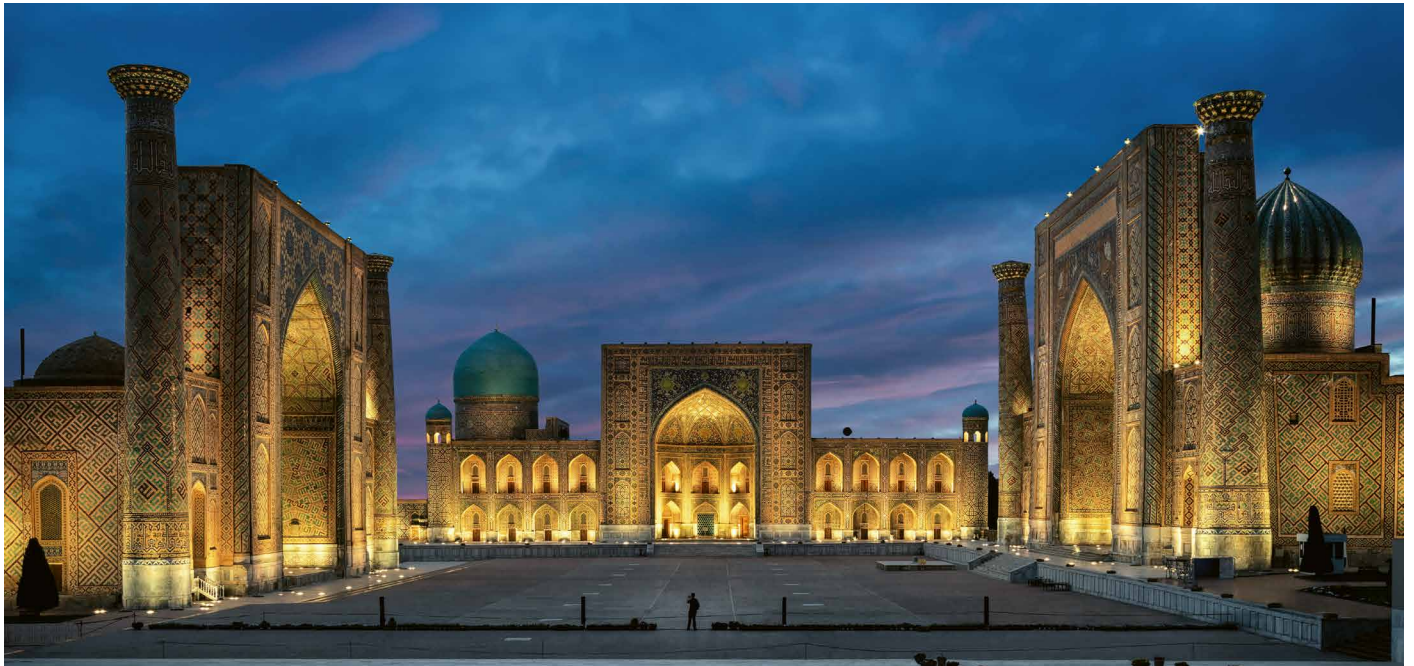
Abendstimmung beim Registan, Samarkand

Entlang des antiken Handelsweges mit Abstecher ins Ferganatal