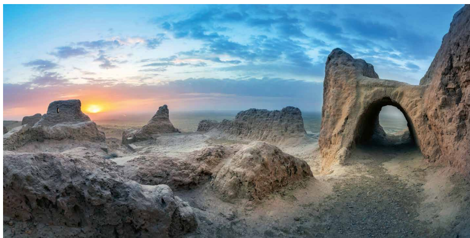
Sonnenuntergang im Wüstenschloss Ayaz Qala