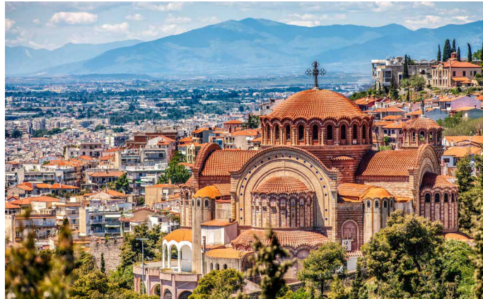
Aussicht auf Thessaloniki