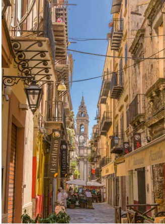
In den Gassen von Palermo