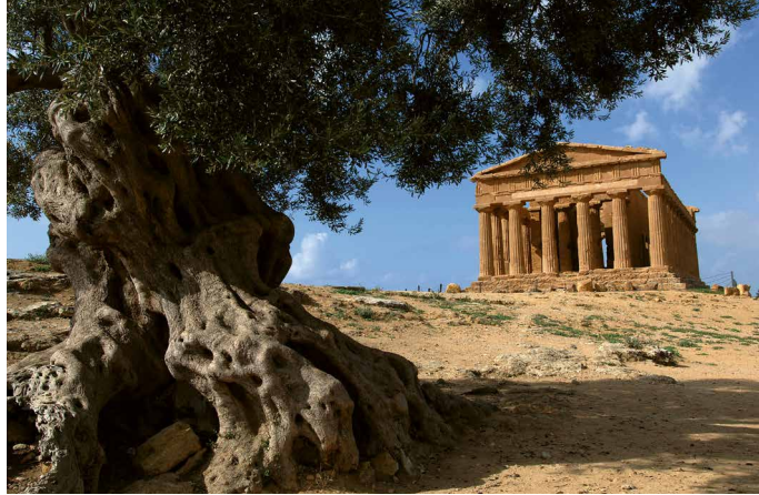
Tempel in Agrigento