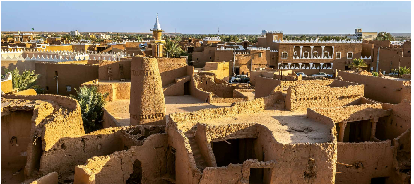
Traditionelle Architektur in Ushaiquir

Lange Zeit war Reisen in Saudi-Arabien nicht möglich. Die jüngste Öffnung des Landes im Zuge bemerkenswerter Reformen im Innern haben gesellschaftliche Veränderungen angestoßen, die sich in vielen Bereichen bemerkbar machen. Unsere Reise zu den Höhepunkten des Landes führt von der quirligen Hafenstadt Dschidda mit dem Schnellzug nach Madina, die zweitheiligste Stadt des Islam. Über die Nabatäerstadt Hegra geht es in die Wüste weiter zu prähistorischen Stätten und prägenden Orten arabischer Kulturgeschichte. Der Abschluss in Riyad schafft den besonderen Kontrast mit einer Moderne voller glitzernder Fassaden.