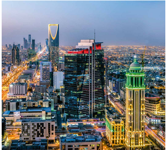
Die moderne Metropole Riyad