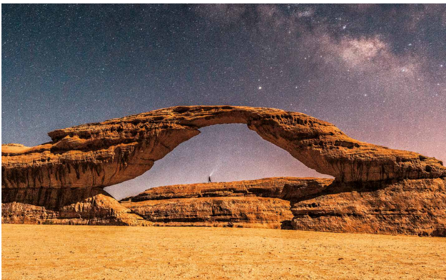
Spektakuläre Wüstenlandschaft bei AlUla

Ein Zwischenhalt in der Ortschaft Uschaiquir, einer wichtigen Station für Mekkapilger vom Persischen Golf und dem Iran, bietet mit seiner dichten Bebauung mit traditionellen Lehmhäusern eine Fülle herrlicher Motive. Diese angestammte Bauweise wird vom saudischen Denkmalschutz seit einiger Zeit wieder bewusst gepflegt. Bevor wir Riyad, die heutige Hauptstadt des Landes, erreichen, erleben wir mit dem Besuch von «Edge of the World» mit seinen spektakulären Klippen, die an eine Western-Kulisse erinnern, noch einmal die einzigartige Naturlandschaft der innerarabischen Wüste. 2 Übernachtungen in Riyad.