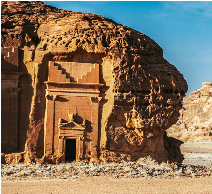
Nabatäisches Erbe in Mada'in Saleh