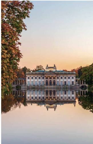
Lazienki-Park in Warschau

Die schönsten Museen und Kunstwerke Polens