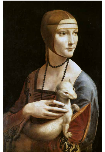
Da Vincis Dame mit dem Hermelin

Die Weltkulturerbe-Stadt Krakau ist eines der schönsten urbanen Zentren nördlich der Alpen. In der von den Zerstörungen des Zweiten Weltkriegs fast gänzlich verschonten Stadt ist die Geschichte vom Hochmittelalter bis zu den Veränderungen des 20. Jahrhunderts in einem unglaublichen Reichtum präsent. «Cracovia totius Poloniae urbs celeberrima» hiess es am Ende des Mittelalters. Auf Schritt und Tritt ist in der herrlichen Stadt, in ihren Gassen, den Wiener Cafés und auf den weitläufigen Plätzen zudem auch immer noch der betriebsame Charme der K&K-Monarchie präsent. Auftakt unserer Reise ist Warschau, das geprägt ist vom Bauboom nach der Wende von 1989. Abgerundet wird die Reise mit einem Aufenthalt in Lodz, wo wir eines der wichtigsten Zentren für Gegenwartskunst in Polen, das Museum Sztuki, besuchen.