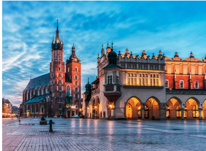
Abendstimmung in Krakau