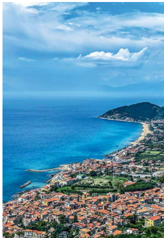
Die Küste bei San Marco