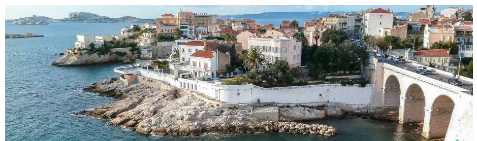
Die idyllische Seite der Stadt - Quartier Malmousque

... aber zum Glück gilt auch: «C'est en revenant qu'on le voit». Mit diesen Gedanken verlassen wir Marseille mit dem Zug wieder Richtung Schweiz.