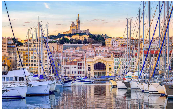
Blick vom Hafen zur Kirche Notre Dame de la Garde