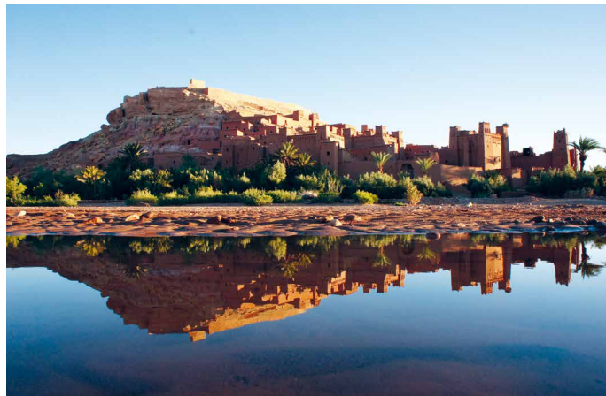
Festungsstadt Ait Benhaddou