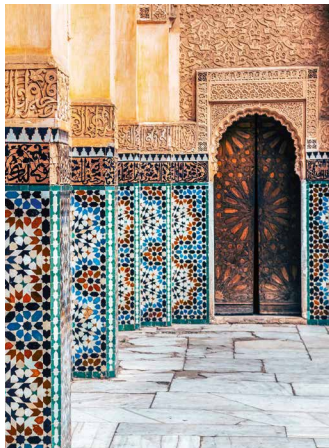
Kunstvoll verzierter Innenhof

Zwischen Königstädten, Atlas-Gebirge und Sahara