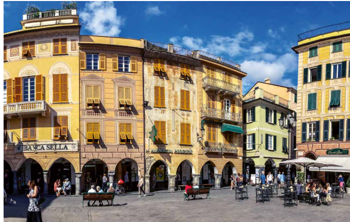
Laubengänge an der Piazza in Chiavari