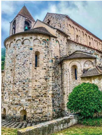
Romanik in Noli

Die grossen Namen und Kunstwerke der Seerepublik