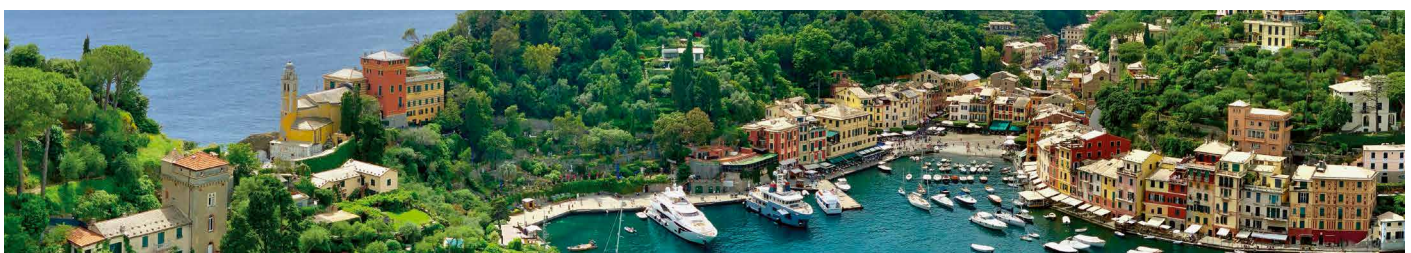
Aussicht auf Portofino