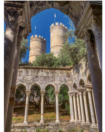
In der Altstadt von Genua