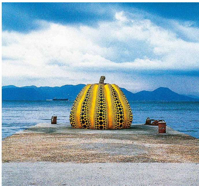
Auf der Kunstinsel Naoshima