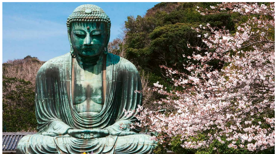
Der Buddha von Kamakura

Zwei volle Tage sind dem reichen kulturellen Erbe der ehemaligen Kaiserstadt und ihrer Umgebung gewidmet. Wir lassen uns Zeit und Musse für die Erkundung einiger der bekanntesten kulturellen Schätze Japans. Unter anderem besuchen wir den idyllisch gelegenen goldenen Tempel Kinkaku-ji, lassen den unergründlichen Zen-Garten des Ryoan-ji auf uns wirken und wandeln durch den Nachtigallen-Flur der Burg Nijo-jo. Dabei bleibt auch Zeit für Einkäufe, Spaziergänge durch die hübschen Strassenzüge der Altstadt oder weitere Tempel und Paläste in Eigenregie zu entdecken.