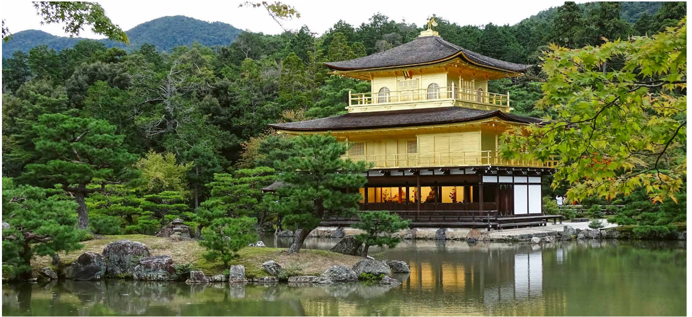
Der goldene Tempel Kinkaku-ji, Kyoto

Geschichte, Kunst und Kultur Japans zur schönsten Jahreszeit