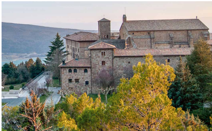
Das Kloster von Leyre