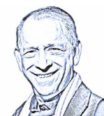
KONZEPT & LEITUNG: Dr. Pablo Diener

Vor der Fahrt zum Flughafen bleibt noch Zeit für letzte Besichtigungen und Einkäufe in Eigenregie. Nachmittags Rückflug nach Zürich.