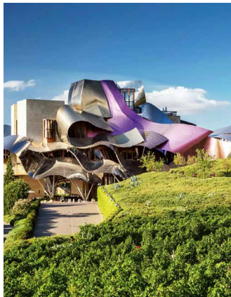
Das Weingut Marqués de Riscal