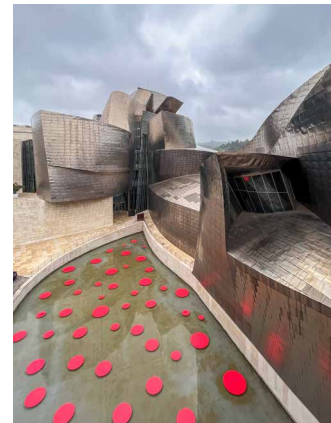
Museo Guggenheim in Bilbao

Das Baskenland hat sich seit dem Niedergang der Stahlindustrie erfolgreich neu erfunden. Auf der kulturellen Landkarte markiert es nun eindrucksvoll Präsenz mit ikonischer Architektur, einer innovativen Kunstszene, hochstehender Kulinarik und einer Pflege der Kulturschätze seiner vielfältigen Vergangenheit abseits aller Musealisierung. Liebliche Weinanbaugebiete, schroffe Berggipfel und malerische Gebirgspässe, über die auch der Jakobsweg führt, sorgen ausserdem für landschaftliche Abwechslung. Und auch für Sprachforscher gibt es im Baskenland noch viel zu entdecken – der Ursprung des Baskischen ist weiterhin ein Rätsel.