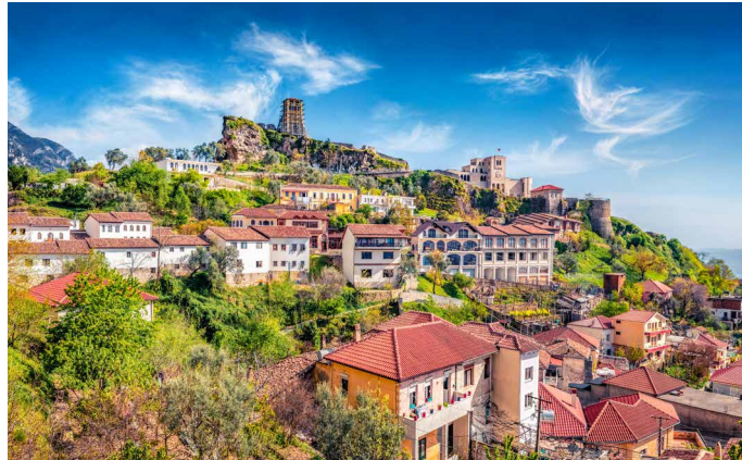
Blick über Kruja, Albanien