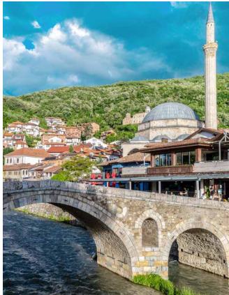
Osmanische Brücke in Prizren, Kosovo