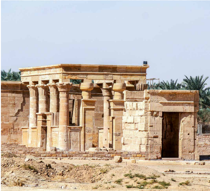
Der Hibis-Tempel in Kharga