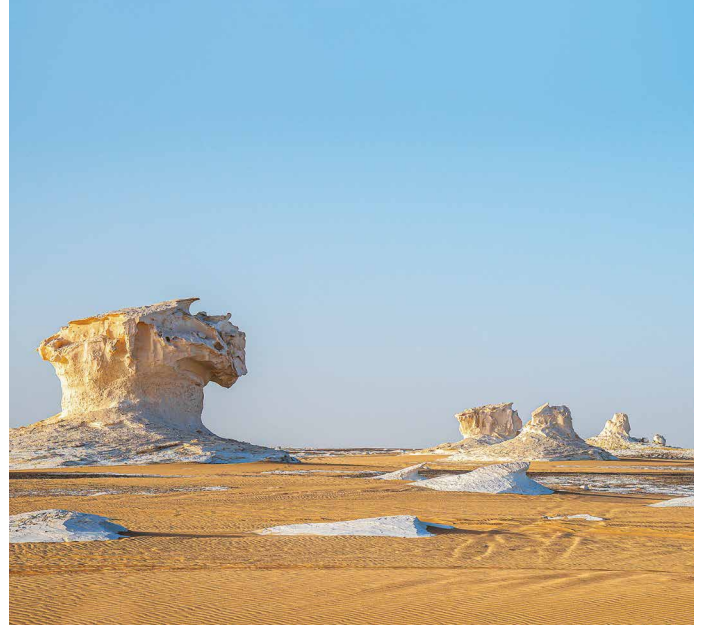
Die Weisse Wüste bei Farafra

Siwa am weitesten vom Nil entfernt liegt, wird sie als einzige bereits in der 5. Dynastie in einem Text genannt. Beeindruckend sind die Festung, das Badr-Museum und die Schwefelquellen. In Dakhla, bei der Ortschaft el Qasr, liegt der wiederaufgebaute ptolemäische Tempel Der el-Hagar, wo später Mönche wohnten; gut zu sehen sind die Reliefs mit thebanischen Göttern und römischen Kaisern. Nicht weit davon entfernt liegt der Gräberberg von Mozawwka mit seinen im ägyptisch-griechisch-römischen Mischstil ausgemalten Anlagen, die durch die exzellent erhaltenen Farben noch heute sehr lebendig wirken. 2 Übernachtungen in Dakhla.