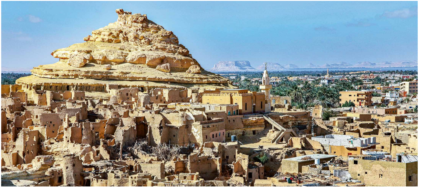
Blick über die Oase Siwa

Auf wenig bereisten Pfaden durch die ägyptische Wüste