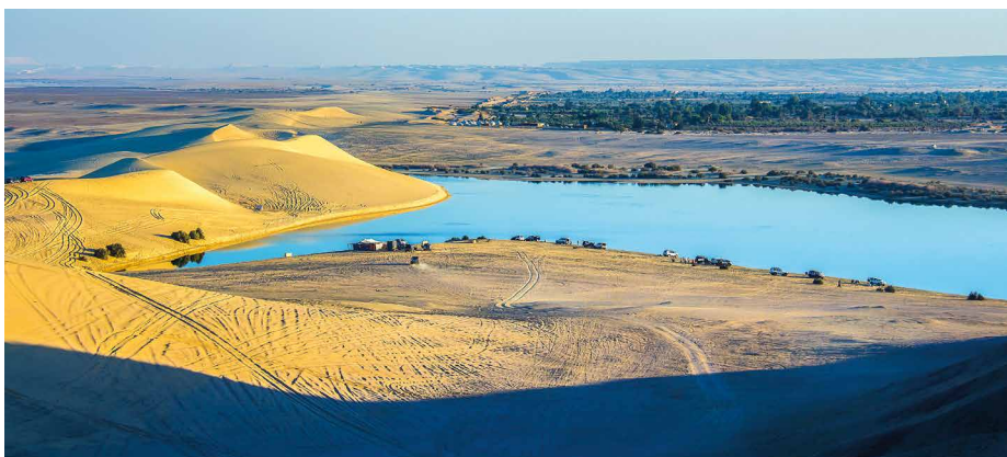
Der Qarun-See bei der Oase Fayyum