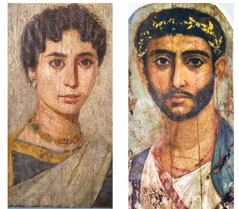
Mumienportraits aus Fayyum

Die kleinste der Oasen ist Farafra. Obwohl sie neben