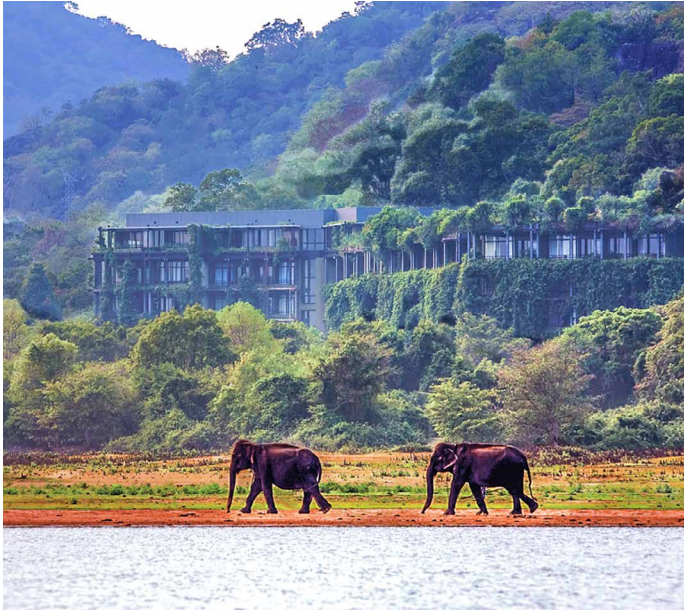
Einer der spektakulärsten Bauten Bawas: Das Hotel Kandalama