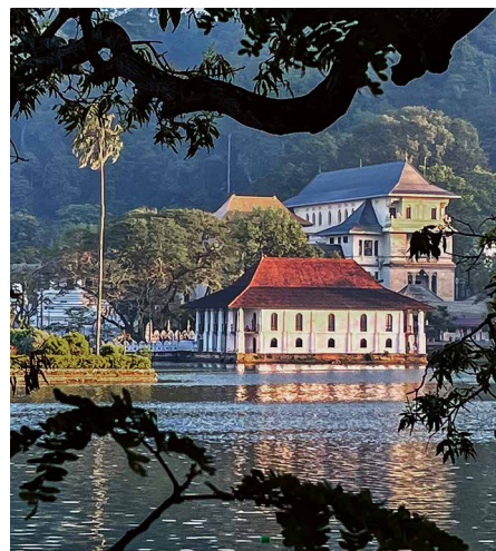
Am Bogambara-See in Kandy

Entlang eines Nationalparks und zahlreicher Stauseen aus dem 3. Jh., die heute noch die Trockenzone mit Wasser versorgen und Heimat zahlreicher, freilebender Elefanten sind, erreichen wir Polonnaruwa, die zweite