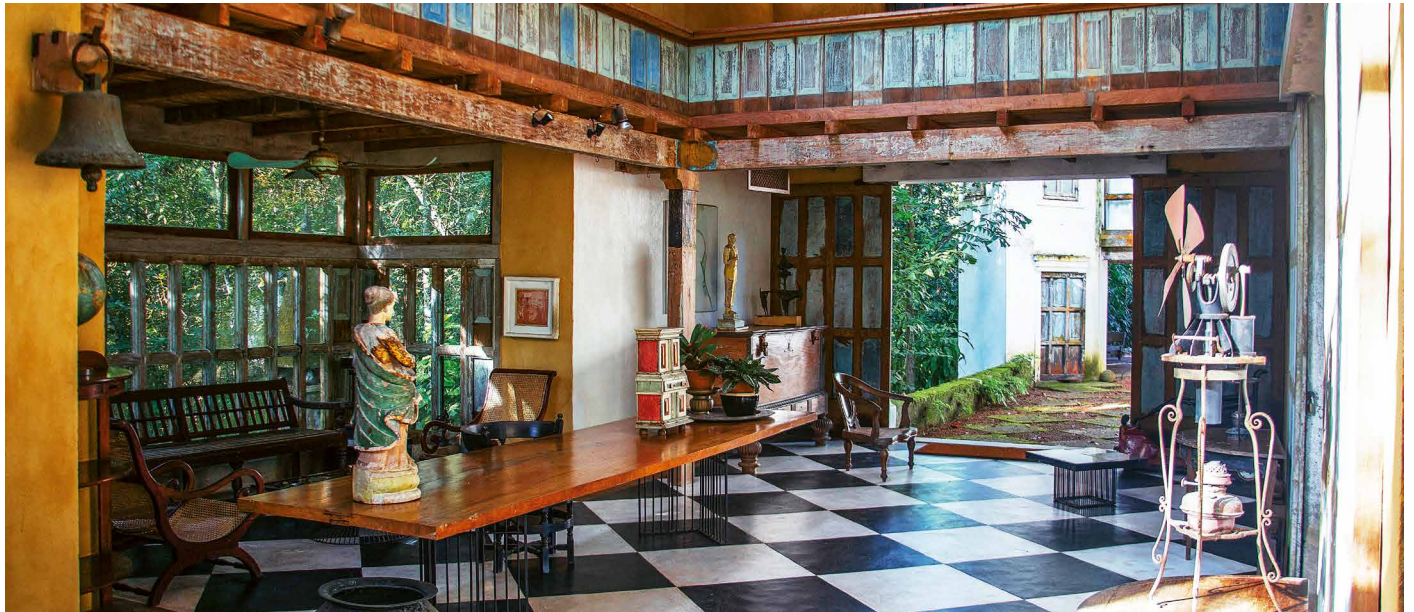
Lunuganga – Bawas Meisterwerk

Auf den Spuren des Architekten Geoffrey Bawa mit Besuch der Ostküste