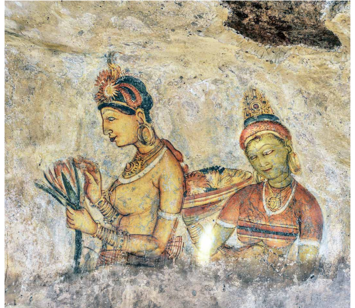
Die Wolkenmädchen von Sigiriya

Die grösste Tempelanlage Sri Lankas setzt sich aus 80 Höhlen zusammen, die mit über 150 Statuen und Malereien aus dem Leben Buddhas verziert sind.