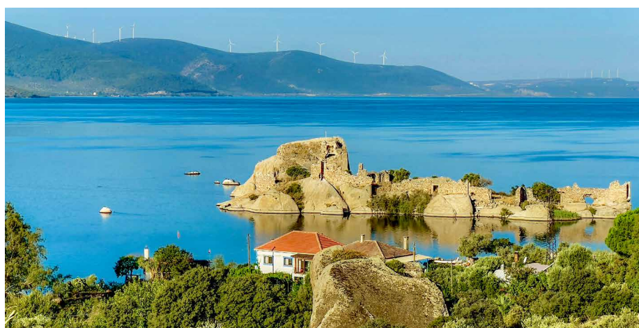
Bafa-See mit Klosterinsel

Morgens Fahrt nach Izmir und Rückflug nach Zürich.