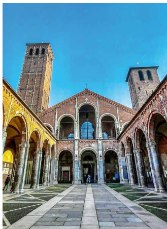
San Ambrogio, Mailand