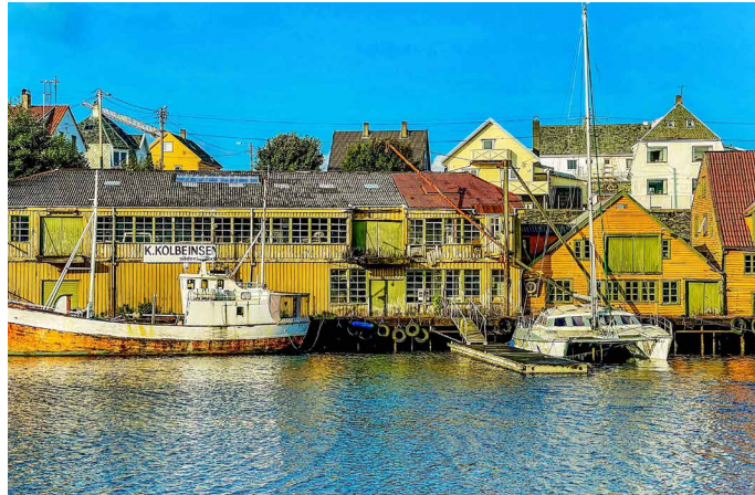
Blick auf Haugesund