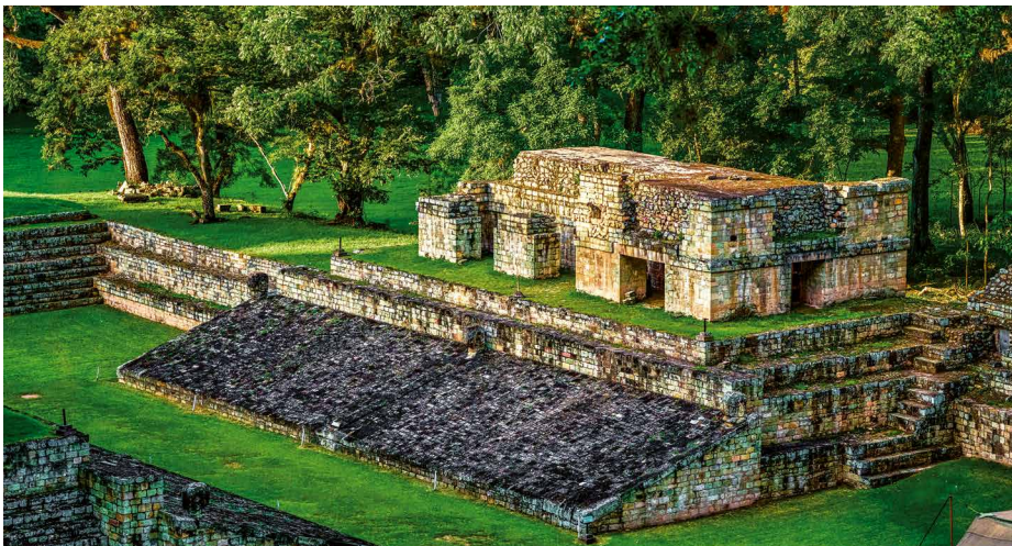
In der Ruinenstätte von Copan, Honduras

Wir lassen uns einen ganzen Tag für die Erkundung der weitläufigen Ruinenstätte Zeit. Wir besuchen die Akropolis, einst religiöses Zentrum der Stadt, den Ballspielplatz und die Stufenpyramide mit ihrer Hieroglyphentreppe. Beim Besuch des lokalen