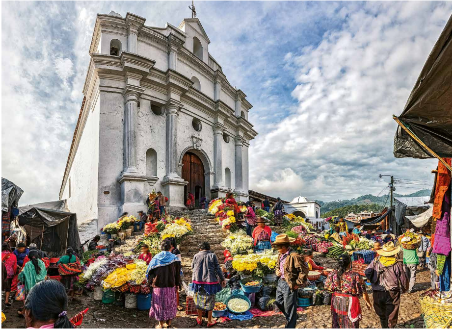
Auf dem Markt von Chichicastenango