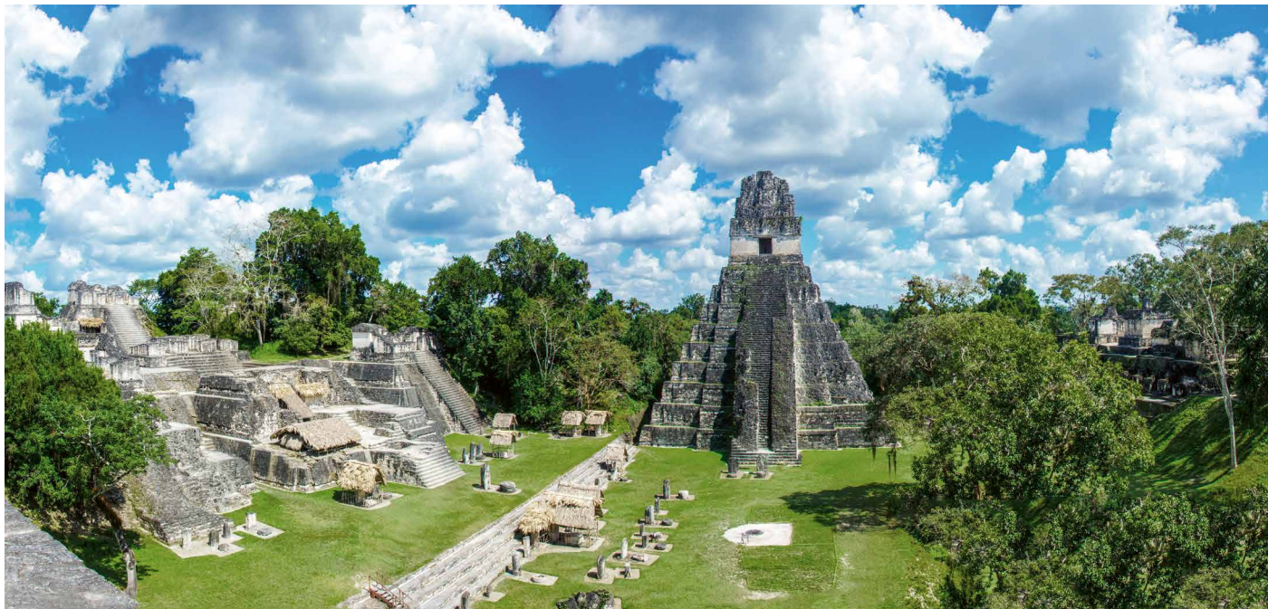
Die Maya-Metropole Tikal

Erleben Sie die Vielfalt der Mundo Maya, das bunte Treiben auf den Märkten der Indígenas, den prächtigen Atitlán-See im Hochland und den üppigen Regenwald im Tiefland. Höhepunkte sind die Maya-Metropole von Tikal und die Ruinen von Copan in Honduras. Zwei Bootsfahrten auf Seen und durch den Urwald ergänzen das erlebnisreiche Programm.