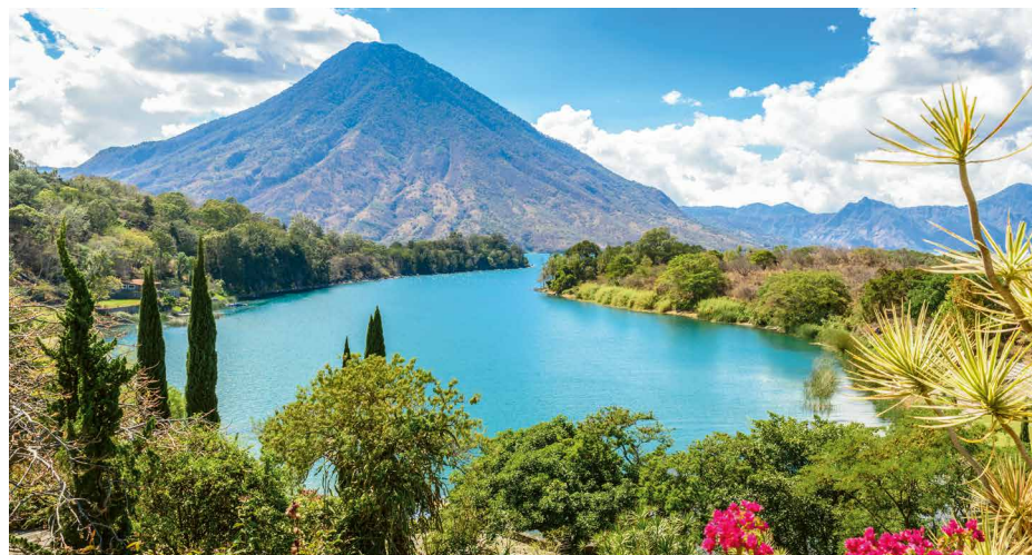
Blick über den Atitlánsee

Tikal war von 250–900 n. Chr. die mächtigste Metropole Mittelamerikas. Die Geschichte seiner 31 Herrscher ist dank der Stelen und Inschriften gut belegt. Die Siedlungsfläche umfasste über 120 km 2 . Die fünf Tempelpyramiden gehören zu den höchsten Bauwerken im Mundo Maya und erlauben einen prächtigen Ausblick auf die hohen Urwaldbäume. Rundum liegt ein Vogelparadies und Naturschutzgebiet mit munteren Affen und putzigen Nasenbären.