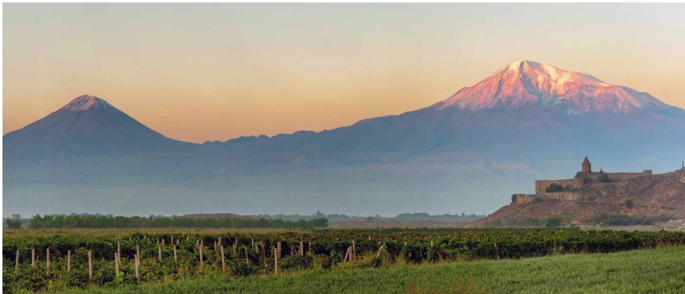
Das Kloster Khor Virap vor dem Berg Ararat

Eine umfassende Reise durch die ältesten christlichen Nationen der Welt