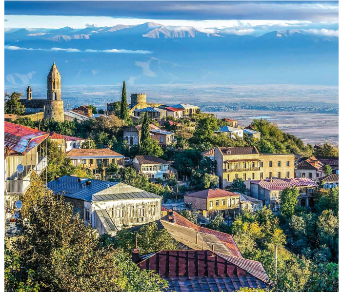
Das Städtchen Signaghi