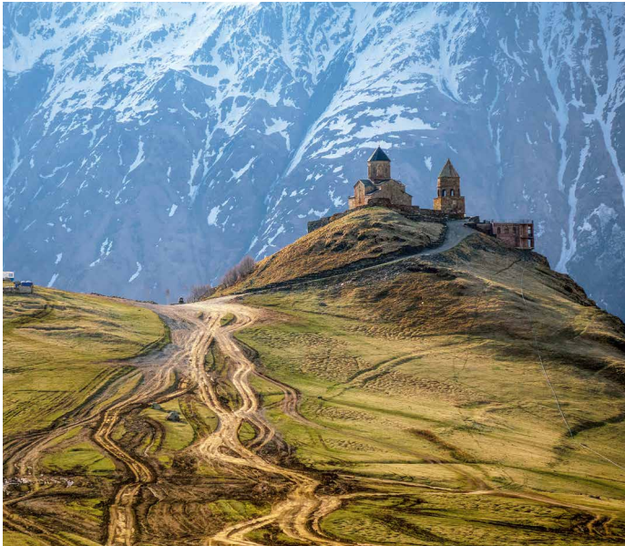
Die Gergeti-Dreifaltigkeitskirche bei Stepantsminda