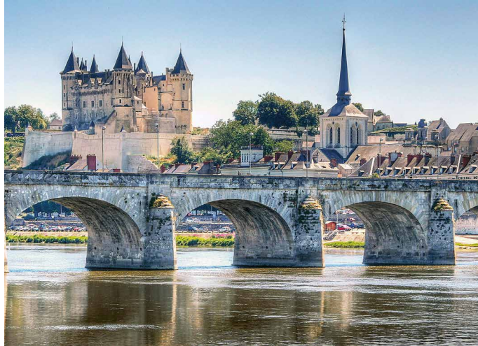
Saumur an der Loire bildet den Auftakt unserer Reise