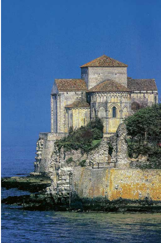
Kirche von Talmont, spektakulär gelegen