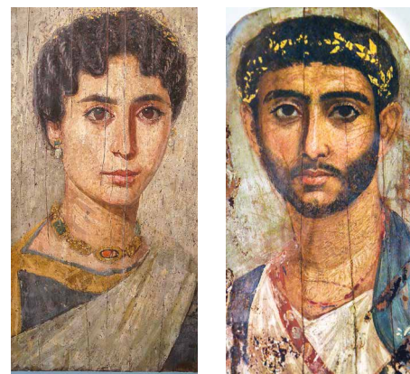
Mumienportraits aus Fayyum

In der Oase El Haiz, die heute zu Bahariya gehört, besichtigen wir die römischen Ruinen. Wir fahren durch die Schwarze Wüste, der Basalt und Dolerit ihren Namen gaben. Anschliessend erleben wir auf unserem Weg nach Farafra eine der eindrucklichsten Landschaften, die Weisse Wüste, wo der Wind in Tausenden von Jahren aus weichem Kalkstein phantastische Gebilde geformt hat. 1 Übernachtung in Farafra.