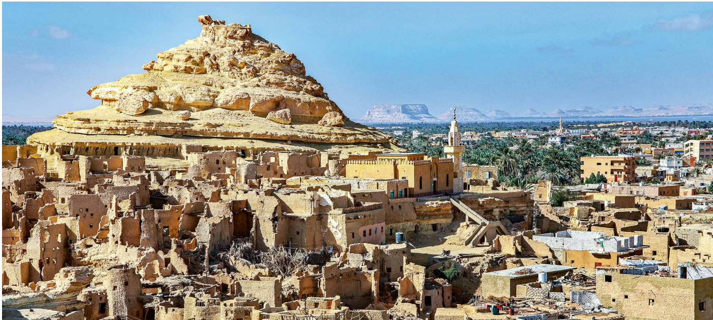
Blick über die Oase Siwa

Auf wenig bereisten Pfaden durch die ägyptische Wüste